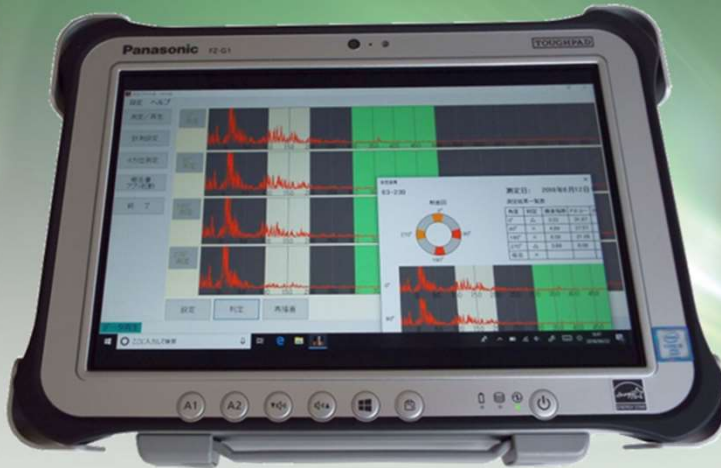
कोरोジンドクター (NETIS: KT-150121-VE)