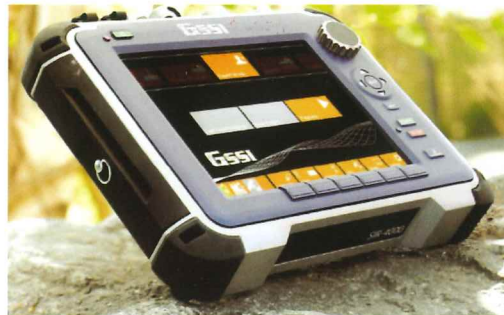
SIR-4000 高機能GPRコントローラ